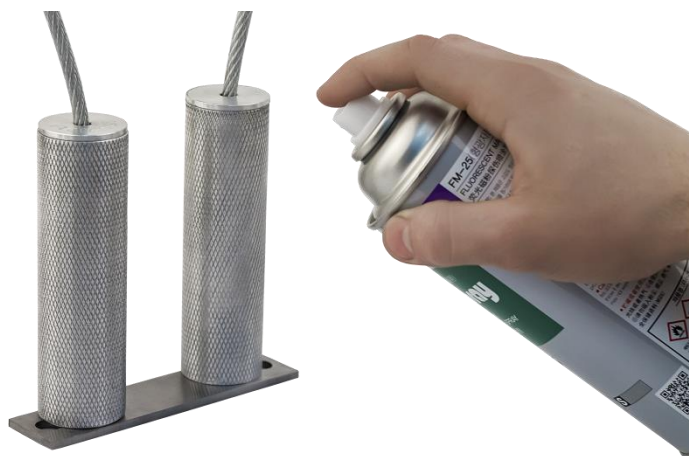
Рисунок 2.1 – Нанесение суспензии на контролируемый участок

2. Нанести на контролируемый участок изделия суспензию для магнитопорошкового контроля (рис. 2.1).