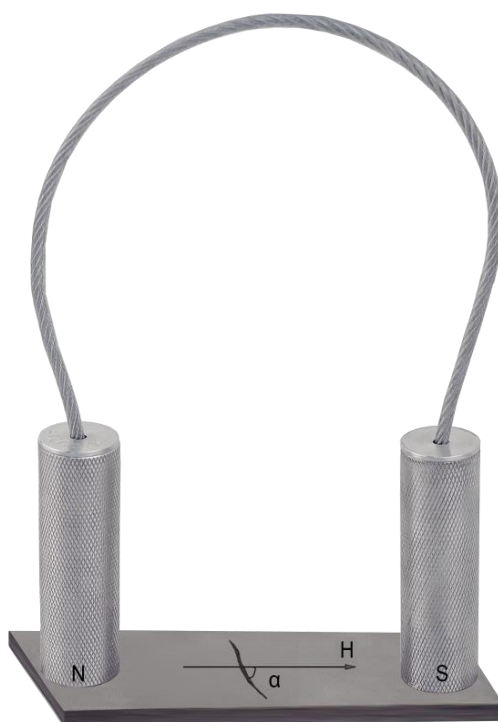
Рисунок 2.2 – Обнаружение дефектов

Если дефекты имеют зигзагообразный вид, то при магнитопорошковом методе выявления они образуют четкий индикаторный рисунок, даже при совпадении направления магнитного поля и дефектов.